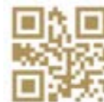
Die Appellationen entdecken

Die Weinbaugebiete von Nantes, das vor 2000 Jahren entstand, als die Römer hier die ersten Reben pflanzten, hat die Jahrhunderte und ihre schweren Zeiten überdauert, so z.B. den schrecklichen Winter von 1709, als die Reben durch Frost völlig zerstört wurden. Man ersetzte sie durch Jungpflanzen der Rebsorte Melon Blanc, die inzwischen charakteristisch für Weine der Weinanbaugebiete Nantes ist.